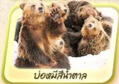
ปอชมมีสีน้ำตาล